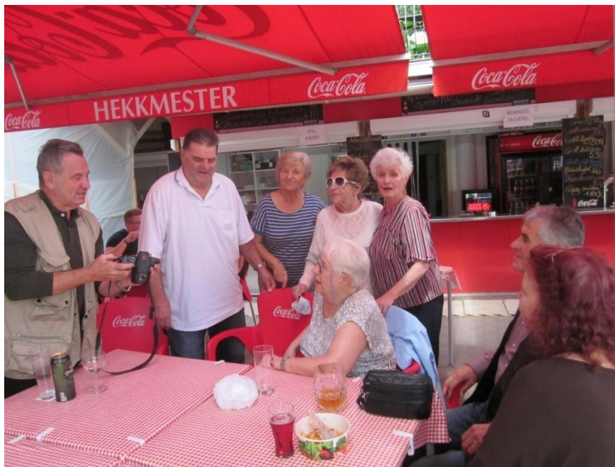
SZIASZTOK! Klassz volt ez a vírusírtás.