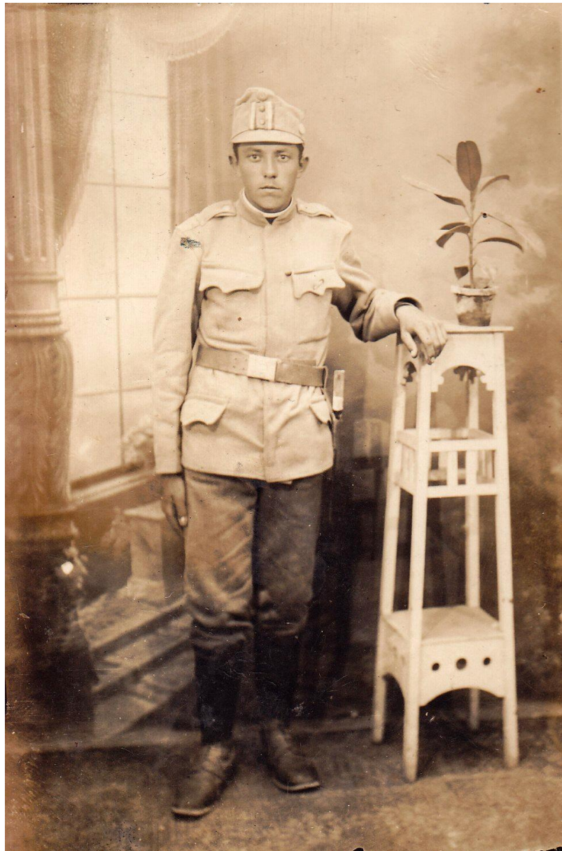
3. Bevonultak a tördemici legények (1902)