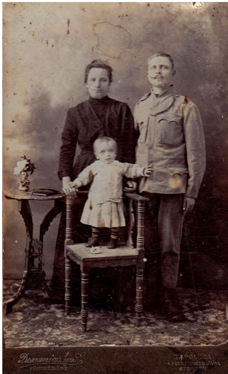
1. Búcsú a családtól a frontra indulás előtt