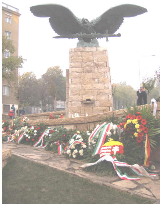
A vitatott emlékmű

• Őseink hitvilága, sámánmisztikus világképe, hiedelem a kettős lélekben, arra a következtetésre jutott, hogy az állatoknak is van lelke. Ez előtti képzelet, a totemizmus világa, ahol őseink totemállatot választottak maguknak. Árpád családjában ez a totemállat volt a turulmadár. Tulajdonképpen a madártól származtatják magukat. A természetben ez a madár nem létezik. Hasonlít a ragadozó madarakhoz, csőre, karmai erre vallanak. Magyar ősi mondákban gyakran szerepel. Neve egyes magyarság kutatók szerint a sok fordítás eredménye. Eredetileg CURUL volt, ami karvalyt jelent. A karvaly gyűjtőnév, ragadozó madarak összessége. Közel jár az igazsághoz egy másik kutató Chermel István, aki a ránk maradt rajzok alapján leginkább sashoz hasonlítja. Mások a fekete sastól, illetve a fekete sólyomtól származtatják. A turulmadárnak van katonai vonatkozása, a mondák szerint a hadra kelt népet vezette a harcra. Korábban még a vezérek zászlóikon is ábrázolták. Írásokból ismeretes Emich Miklós csicsói várnagy, mint Erdély sasának hordozója - vagyis