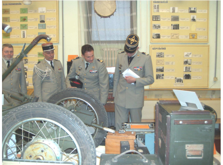
Francia küldöttség a Híradó Múzeumban

megállapították, hogy a kredit rendszerű képzés eredményeként iskoláink képesek a tananyag és a diplomák kölcsönös elismerésére. A bemutatók a továbbiakban a Híradó Tanszéken folytatódtak. A tanszékvezető francia nyelvű előadásban ismertette a híradó képzés rendszerét, valamint javaslatait a „COMMIT” híradógyakorlatok hazai és