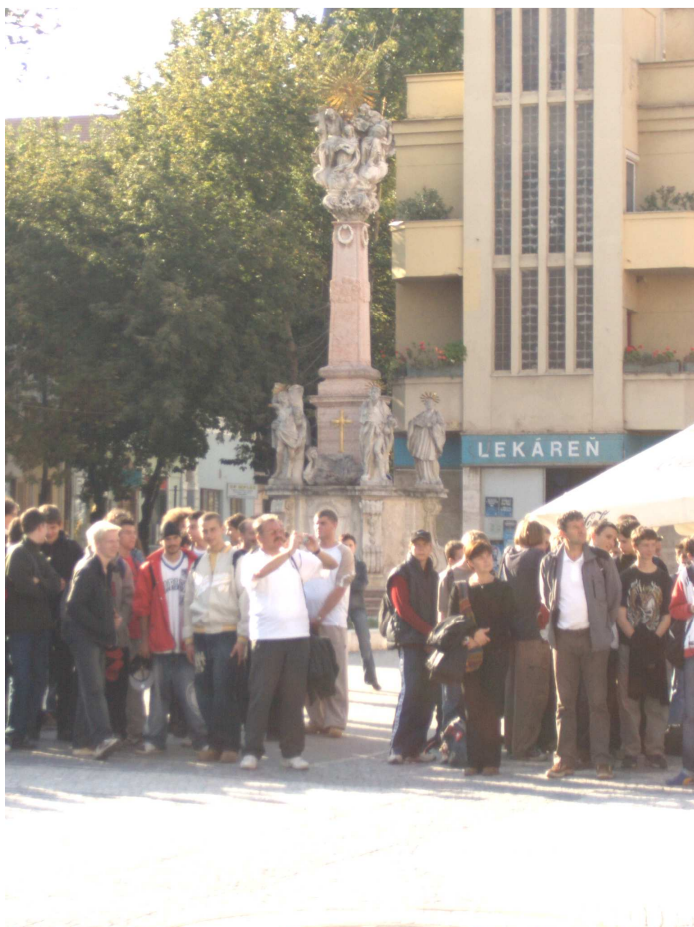
Komáromi kiránduláson a Puskás technikum diákjaival