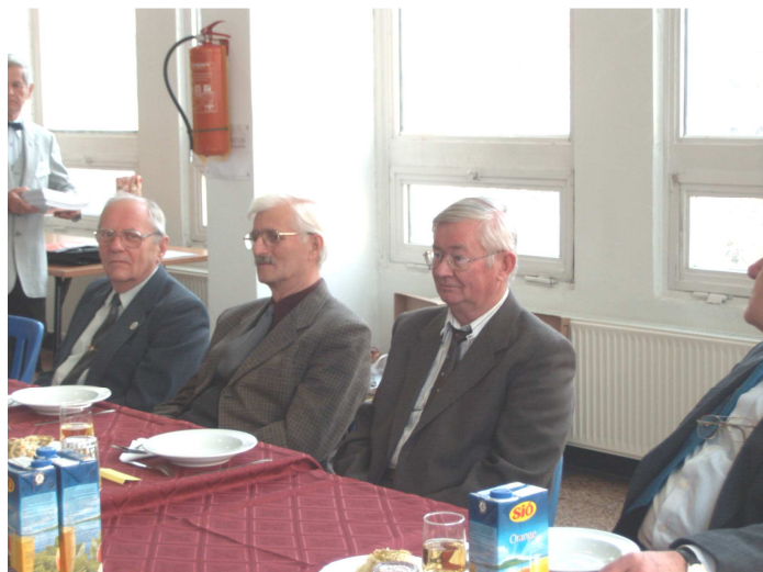
Bolyai klub: évzáró értekezlet utáni ebéden