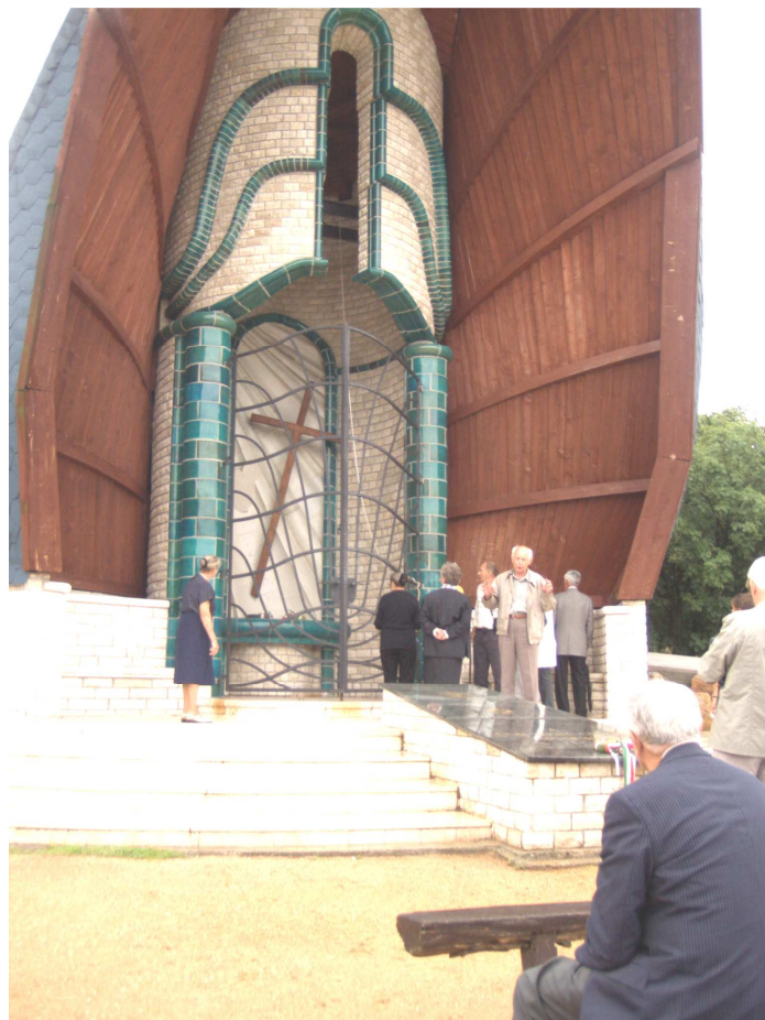
Hősök Kápolnája (Székesfehérvár)