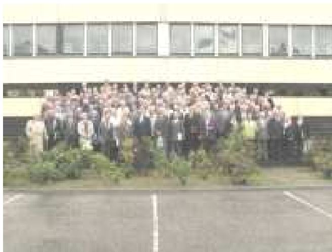
50 éve avatottak

Az Egyesített Tiszti Iskolán a tanulási időt kezdetben kettő, illetve három évben határozták meg. 1961-ben vezették be a négy éves képzést, az első év a csapatnál volt. A képzés színvonalát oly módon emelték, hogy az itt nyert képesítést polgári szakképesítésként is elismerték. 1964. szeptemberében avattak először olyan tiszteket, akik már két - tiszti és szaktechnikusi, illetve tanári diplomát kaptak. Fennállásának 10 éve alatt 2732 tisztet bocsátott ki, 1410-et két diplomával avatott,