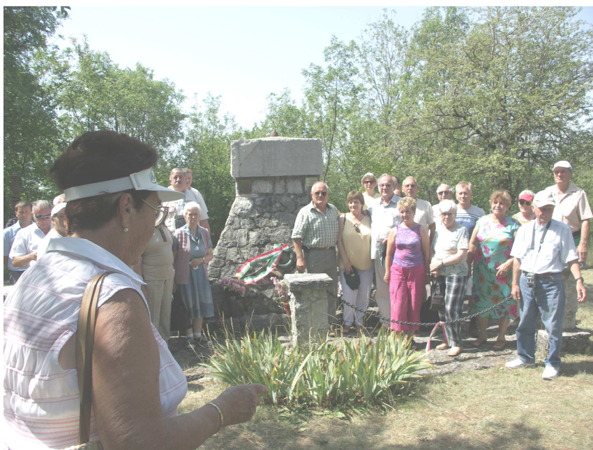
Tisztelgés a Magyar Hősök előtt

felkerestük Nova-Gorica és a St. Michele körzetében található háborús hadszíntéren az akkor létrehozott állásokat, építményeket, melyek napjainkban is érintetlenül vannak hagyva emlékeztetve az itt harcoló katonák szenvedéseire. Megcsodáltuk az olasz állam által létesített emlékparkot és múzeumot. Megkoszorúztuk a Magyar Királyi 4. gyalog ezred emlékére felállított emlékművet és itt is mint másutt a himnusz hangjaival emlékeztünk elődeinkre. Ezután meglátogattuk a magyar osztrák temetőt ahol több ezer magyar és osztrák katona nyugszik. Felemelő érzés töltött el bennünket az a gondosan ápolt katona sírok látványa melyért dicséret illeti meg azokat az államokat köztük hazánkat is, hogy katonáink nincsenek elfeledve. A temetőben és más emlékhelyeken láttuk a koszorúk alapján, hogy sok társadalmi szervezet látogatja e helyeket.