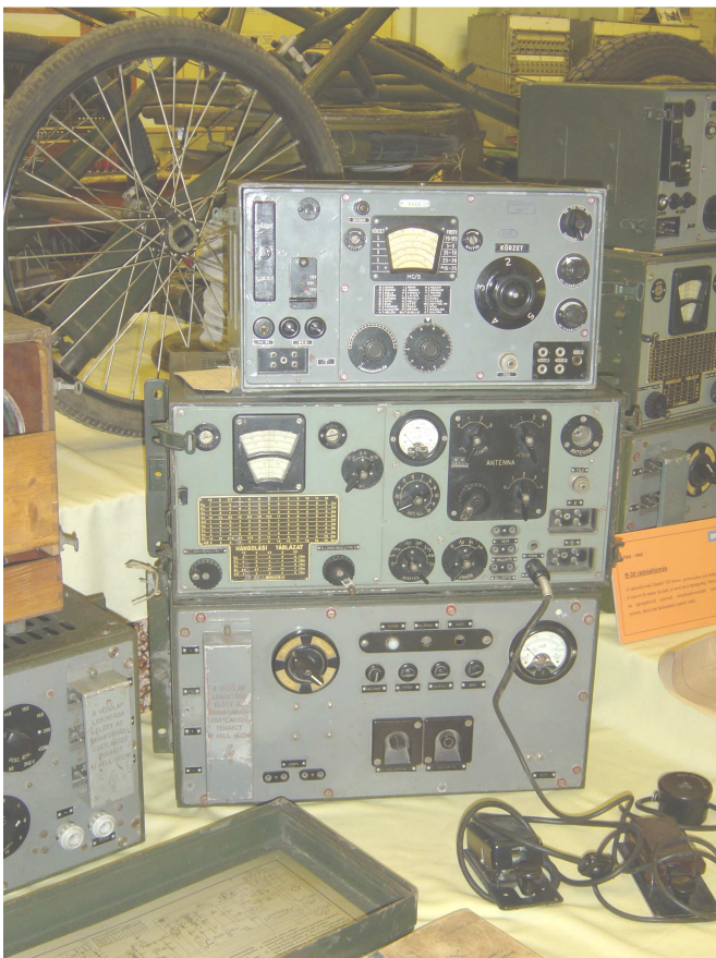
R-30 rádió állomás

A mai helyére az alagsorba, az épület felújítása után került 1985-ben.