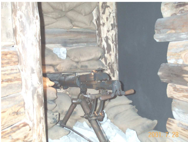
Schwarzlose géppuska tüzelőállásban

A másik oldalon egy éjszakai harcot mutatnak be. A hangeffektusok jól adják vissza a puskalövések, géppuskasorozatok tüzérségi eszközök, illetve a