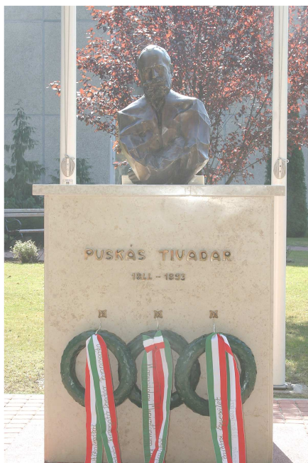
Puskás Tivadar szobra „új helyén”

felolvasása után megemlékeztek Puskás Tivadar életéről és tevékenységéről. Az ünnepség után felavatták és felszentelték, új helyén, méltó környezetben, a Zách utcai laktanyában, Puskás Tivadar mellszobrát. A szobornál koszorút helyezett el HVKF, MH TD parancsnoka, illetve a Puskás Tivadar Távközlési Technikum és a Puskás Tivadar Híradó Bajtársi Egyesület képviselői.