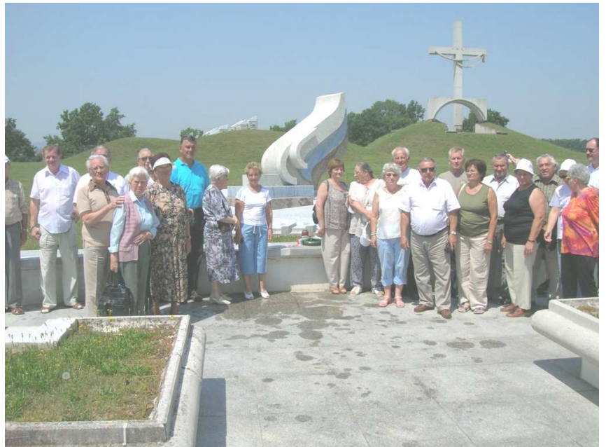
Tisztelgés a Szlovén Hősök előtt