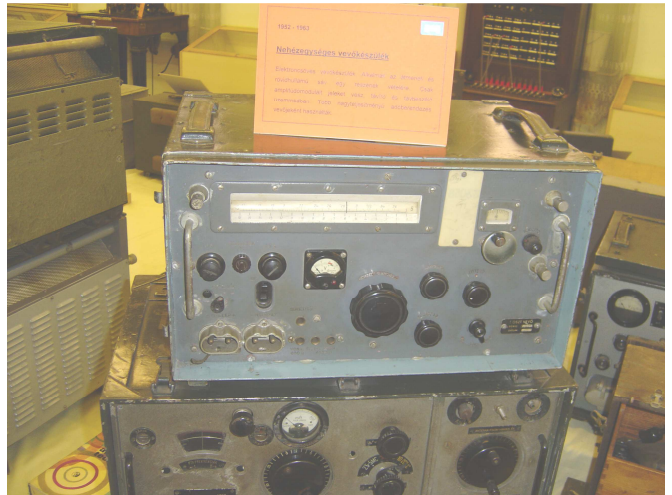
Nehéz egységes vevő