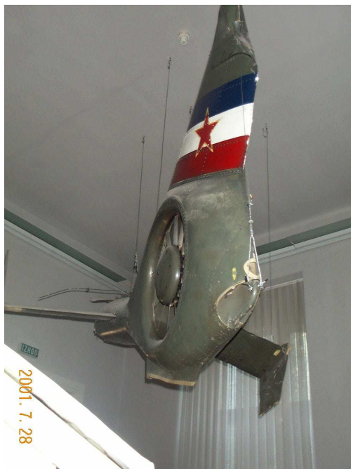
Lelőtt Gazelle helikopter roncsai

Az „I terem” a Független Szlovénia nevet kapta és ez nyilvánvalóvá teszi, hogy a függetlenné válás harcai válnak szemléletessé. A szlovének még nagyon jól emlékeznek 1991 sorsdöntő eseményeire, amikor Szlovénia függetlenné vált győzedelmesen megvívta harcát, mind katonai, mind polgári téren. A terem egyik oldala a tíz napos háborút mutatja be. A „harckocsi háborút” egy lejtős menetben haladó harckocsioszlop nagyméretű fényképe szemlélteti, míg a levegőből jött fenyegetést a mennyezetről alálógó lelőtt Gazelle helikopter roncsai. A másik oldalon a polgári események dokumentumait láthatjuk; az új ideológia megjelenését a pártok zászlobontását, az első választást, a népszavazást és a függetlenség kikiáltását. A harci eseményeket egy felállított monitoron lehet szemlélni. A teremben láthatók még a függetlenné vált ország hadseregének rend- és vámőrségének egyenruhái.