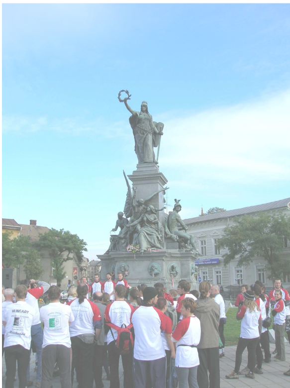
Arad, 2008. október 6.

Pannonia vergiss deine Tode nicht, als Kläger leben Sie.