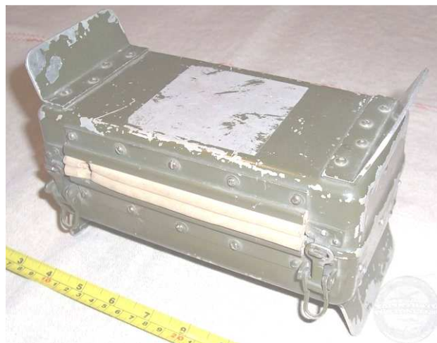
Vezetékes csatlakozó doboz

Mivel az 1956-os forradalmi eseményeket követő változások során az ezredparancsnok helyettesi beosztás megmaradt a korábbi ajánlatot megköszönve nem fogadtam el.