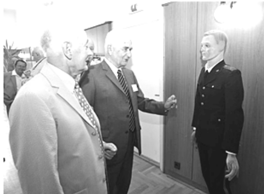
Ünnepi megemlékezés a II. RFKK egykori növendékeivel