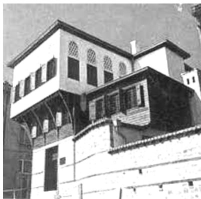
A száműzöttek rodostói otthona