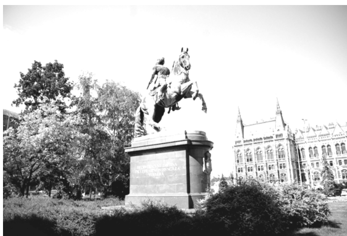
Rákóczi szobra a Parlament előtt

Lengyelországból Versailles-be ment, ahol fogadta XIV. Lajos. A fejedelem az udvarban élt, majd elhagyta a fényűző udvart és bevonult