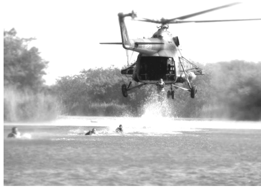
A szentesi II. Rákóczi Ferenc Műszaki Ezred gyakorlaton

kassai díszes temetést a korabeli filmfelvétel is megörökítette. Az ország valamennyi vármegyéjére díszegységgel képviseltette magát.