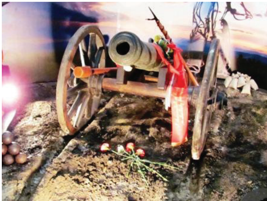
Gábor Áron ágyúja

Kétszáz éve született az 1814-49 évi forradalom és szabadságharc egyik kiemelkedő alakja, a székely ágyúöntő, a háromszéki Gábor Áron. A néhány évi rendszeres határőri szolgálat után ezrede tüzérré képezte ki. Gyulafehérvárt, Pesten, majd Bécsben sikerült elsajátítania a tüzérségi alapismereteket, miközben betekintést nyert az ágyúgyártás műszaki ismereteibe is. Ennek ismeretében megdőlt az az elképzelés, hogy egy fűrész- és faragó székely műszaki ismeretek nélkül ágyúöntésbe fogott. Közben asztalosmesterként dolgozó Gábor Áron 1848. november 16-án a sepsiszentgyörgyi nagygyűlésen mondta el legendás mondatát: lésszen ágyú. Felajánlotta, hogy két héten belül ágyúval és lőszerrel látja el a háromszéki székely erőket. A hadianyaggyártás központja Kézdivásárhely lett, ahol Turóczi Mózes rézöntő műhelyében készültek a lövegek. A székely falvak egymással versengve ajánlották fel harangjaikat, hogy legyen ágyú az önvédelemre. A kozákok betöréséig 64 ágyú készült el. Közben a nagyváradi gyárban tanulmányozta a Congreve-rakétákat, és Kézdivásárhelyen elkezdte a gyártásukat. Gábor Áront előbb honvéd főhadnaggyá, majd századossá,