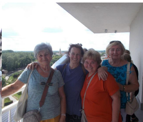
Leányok a poroszlói torony teraszán