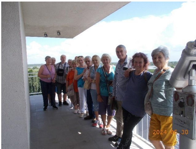
A Híradó Tagozat

A múlt emlékeit magunkba zárva buszra szállva elindultunk a Hortobágyon át Poroszlóra Tisza-tavi Ökocentrumba, ahol csoport kísérelével megcsodáltuk a „3D programcsomag” attrakcióit: A főépületben Európa legnagyobb édesvízi akváriumrendszerének minden bemutatóját, kiállítását, a játszósobát és a kilátótornyot. A mozi teremben láttunk egy 12 perces a „Négy évszak a Tisza-tavon” című 3D (háromdimenziós) természetfilmet.