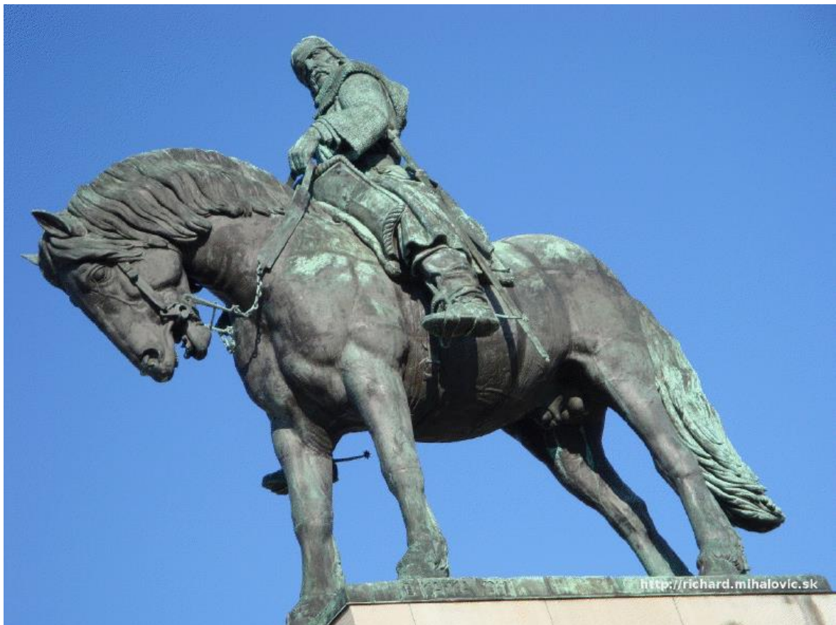
Zsizska a lován

Zsizska több harcászati újítást is bevezetett. Ilyen, a mobil erőd, vagyis a szekérvár ( Ezt még IV. Béla Muhinál rosszul alkalmazta. ). A tábori tüzéséget is ő használta először, addig csak vártüzérség volt. A pisztoly használata is az ő idejében kezdődött el.