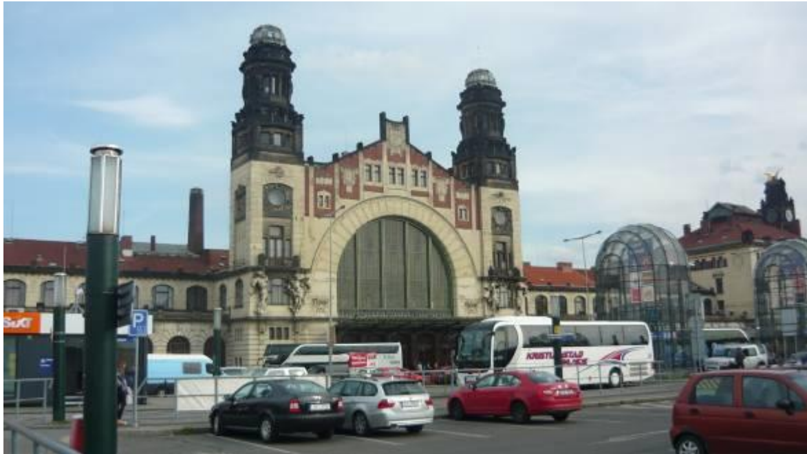
A prágai Főpályaudvar

Több órányi buszozás, és több dugó végig bumlizása után megérkeztünk Arany Prága száztornyú városába, a Birodalom egykori Fejébe, a Barokk-városba. A legjobb belvárosi parkoló a pályaudvar mellett található, ahonnan az új központ csak néhány száz méter gyaloglást igényel.