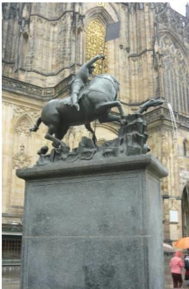
Sárkányölő Szent György

A vár és a Moldva között található a „Kisoldal” elnevezésű városrész, melyet 1257-ben még II. Ottokár emelt szabad királyi várossá. A Kisoldal Prága Budája, azzal a különbséggel, hogy a Moldva baloldalán fekszik. (Míg Buda a Duna jobb partján terpeszkedik.) IV. Károly, majd II. Rudolf és II. Mátyás sokat tett a Kisoldal felvirágoztatásáért, de a Fehér-hegyi csata, 1620 után, amikor az uralkodók Bécsbe költöztek a Kisoldal „elzüllött”. Ma egy bájos, élő építészetimúzeum.