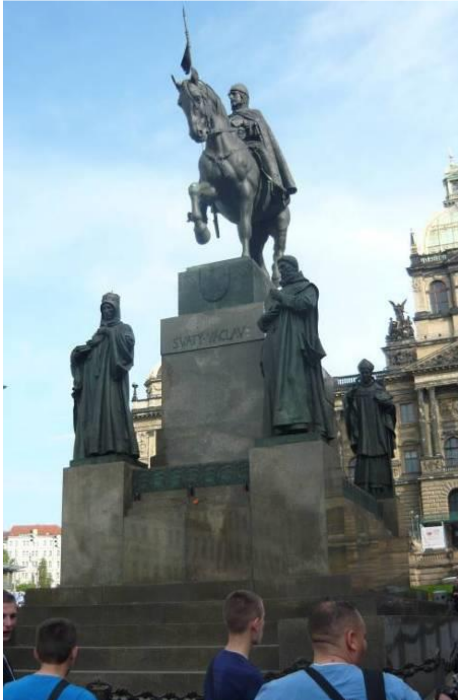
Szent Ludmilla - Szent Vencel - Szent Prokopot - Szent Adalbert

illő legendái vannak. Egyikben azzal győzte meg a kolostoralapításról Ulrik herceget, hogy a vizet borrá változtatta. (Ő volt Krisztus2.) A másik szerint az ördögöt az ekevas elé kötötte, és árkokat szántott vele. III. Ince nem sokat vacakolt, (Hiszen, ha az ördöggel szántatott jó HR menedzser lehetett.) 1204-ben szenté avattatta.