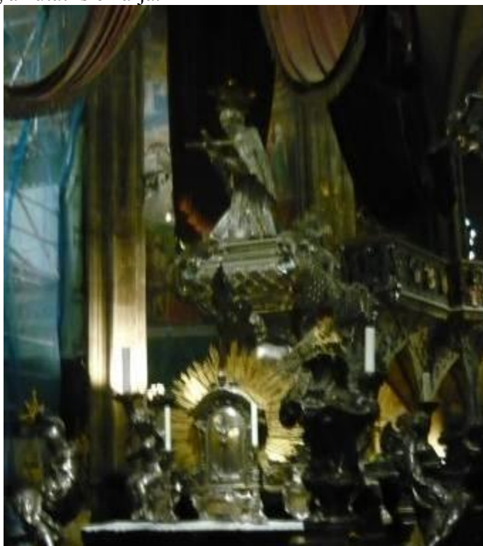
Nepomuki Szent János Síremléke

Vele szemben látható a Lorettói Szűz Mária temploma, mely magába foglalja az Úr Születésének templomát is. A térről nyíló utcában található az 1600-ban épült reneszánsz Hradzsini Városháza. A Hradzsini térre érve jó időben érdemes lefotózni a Schwarzenberg és Lobkovic Palotát, valamint a barokk Szent Benedek templomot. Aztán jöhet a Toszán, a Martinic, az érseki és a Sternberg palota is. Jelenleg mindegyik valamilyen középület. Esőben mindenre nincs idő. Irány Prága koronája az egykori királyi vár. 1918-ig királyok lakták, azóta a köztársasági elnök rezidenciája. Utóbbi jelenlétét manapság is zászló jelzi. A vár udvarán található a Szent Vitus katedrális. Melynek építését még 1344-ben IV. Károly rendelte el, és csak Szent Vencel halálának 1000. évfordulójára, 1935-re készült el teljesen. A 124 méter hosszú, 33 méter magas gótikus főhajó szerintem aránytalan, túl keskeny. Ezért, legalábbis engem nem fogott meg. A mellékhajóból nyíló 24 kápolna eklektikus, (vagyis ellentétes, összeférhetetlen tárgyakat, rendező elv nélkül próbálnak összeegyeztetni) . Kiemelném Nepomuki Szent János barokk ezüst síremlékét, amely maga az őskáosz, és még az utat is elzárja.