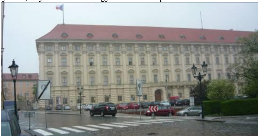
A Cernin Palota

Néha szemerkélő, néha zuhogó eső erősen hátráltatta a kültéri nézelődést, így inkább csak Királyi Palota és a Szent Vitus Katedrális került a szemlélődés középpontjába. A látogatást a legmagasabb ponton, a Strahovi Kolostornál célszerű megkezdeni, mert ebben az esetben egészen a Moldváig csak lefelé kell sétálni. A kolostort 1140-ben I. Vladiszlav alapította premonstreiek számára, majd II. Rudolf bővítette. Híres a könyvtára, és a ma is működő serföldéje van. Lefelé jövet elérünk a Loretto térre. Felső oldalát, a három emeletes, 150 méteres Cernin Palota zárja. 1669-ben kezdték építeni. 1848-tól 1928-ig kaszárnya volt, majd 1932 óta a külügyminisztérium épülete.