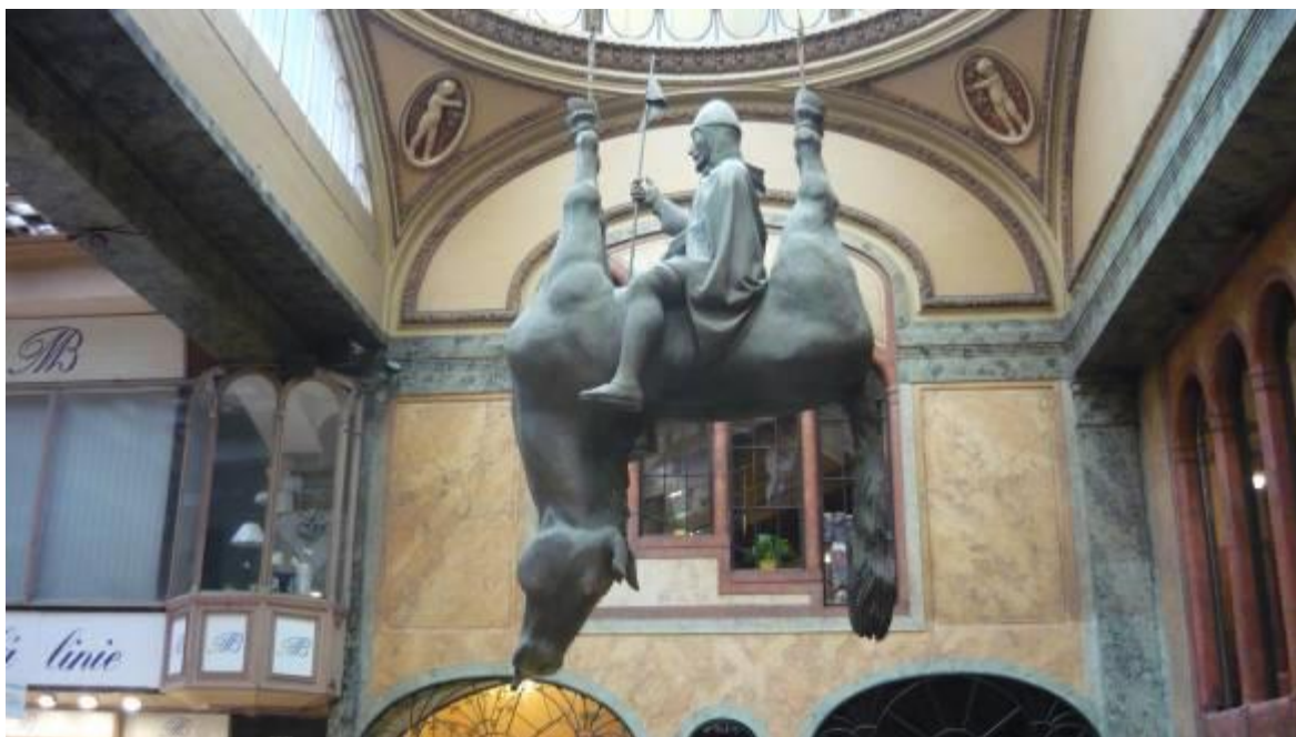
Vencel, a király fordítva ül a lován