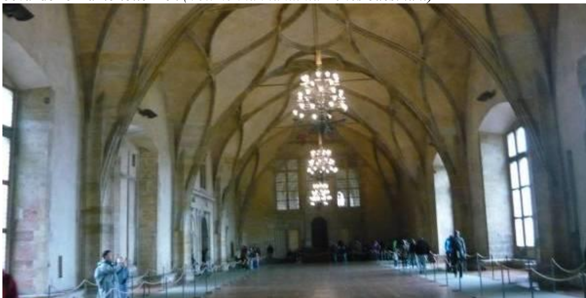
Valahonnan innen dobták ki a császár követeit

A második kihajításra 1618-ban került sor. (Kevés volt a cseheknek a II. Rudolf és II. Mátyás által biztosított „dőzsi-habzsi”). A császár három követét kidobták a királyi palota ablakán, és ezzel kezdetét vette a 30 éves háború. (A kidobottaknak óriási szerencséjük volt, mert 18 méteres zuhanás után egy szemétdombra estek, ahonnan sikerült elmenekülniük.) A defeneztráció első évfordulóján 27 protestáns vezetőt fejeztek le. Fejüket egy évre a Károly-hídra tűzték ki közszemlére. A 30 éves háború alatt Csehország lakossága 3 millióról 900.000-re csökkent, valamint területének háromnegyed részét jóvátétel gyanánt lefoglalták. A protestánsokat kiszorították, és helyüket német bevándorlókkal töltötték fel. (Volt honnan tanulnia Benes bácsinak!)