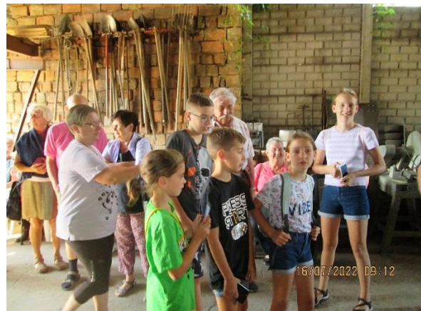
Ifjúsággal a műhelyben