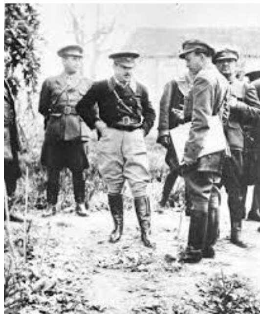
Lukács tábornok Spanyolországban

A Zalka Máté nevét viselő tiszti iskola már elhelyezésében is felülmúlta az Orosz Tengerészeti Torpedó Iskolát. Míg utóbbi, egy a fővárostól 30 km-re levő, inkább a Kronstadti Szent János ünnepről híres szigeten volt található, addig a Zalka a magyar főváros elit, budai oldalán, a Budaörsi bulvárra nyíló főkapuval a Budai Sas-hegy oldalán terpeszkedett. Azt is még fontos megjegyezni, hogy a befogadó laktanya Petőfi nevet viselte, „ami nagyon ott van!”.