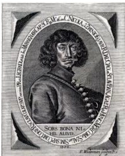
Gróf Zrínyi Miklós

Aktív tiszti pályafutásod, 1974 után sem tétlenkedtél. Létrehoztad a nyugállományúakon belül a híradótagozatot, majd 1998-ban megalapítottad a Puskás Tivadar Híradó Bajtársi Egyesületet. Mikor ez is sínre került, tekinteted az Olyposzra szegezvén, a múzsák segítségével szépírói babérokat gyűjtöttél be. A mai nap bemutatásra kerülővel együtt 3, életrajzi ihletésű könyved jelent meg.