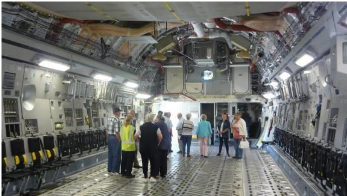
A C-17A „gyomrának” eleje