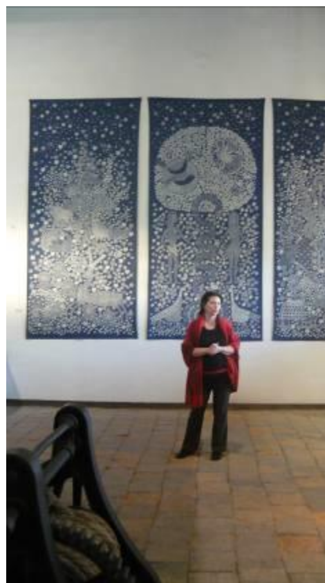
Bódy Irén kiállítása