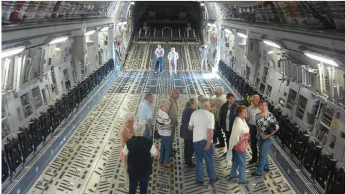
A C-17A „gyomrának” hátulja