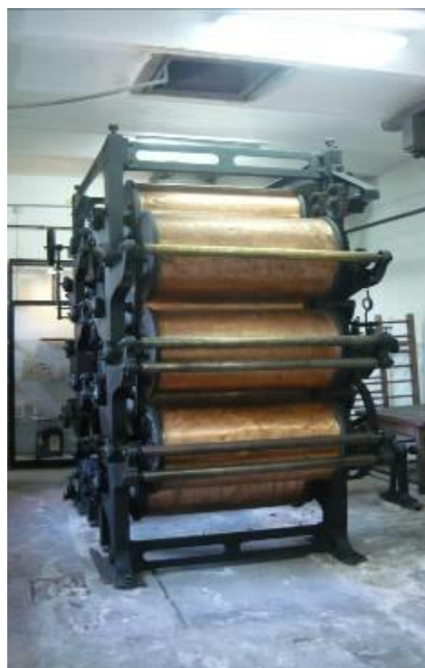
A 14 hengeres szárító