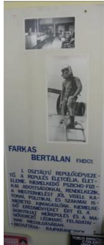
Berci és méltatása