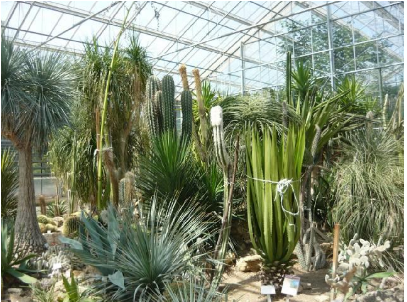
A Nemzeti Trópus részlete a növekedési hitel alkalmazása előtt

Két üvegház, a trópusi és pálmaház, illetve a kaktusz és pozsgásházban több ezer növény tekinthető meg. A sziklakertben több mint 3000 féle évelő és hagymás, gumós növény található, a világ minden területéről. A sok-sok növény nevét nem tudtuk megjegyezni, képtelenség is lenne. De a csodálatosan szép lila virágú kínai júdásfát már messziről felismertük az erős illatáról.