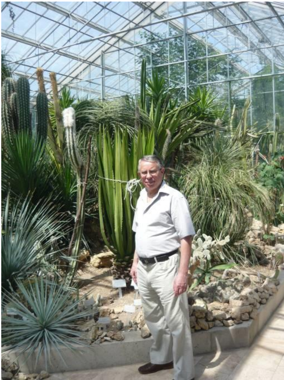
A „Soós-kaktuszok” egy kb. 70 éves példánya

A nemzetközi hírű vácrátóti botanikus kert évente mintegy százezer látogatót fogad. Az országban itt található meg a legnagyobb növényrendszertani gyűjtemény.